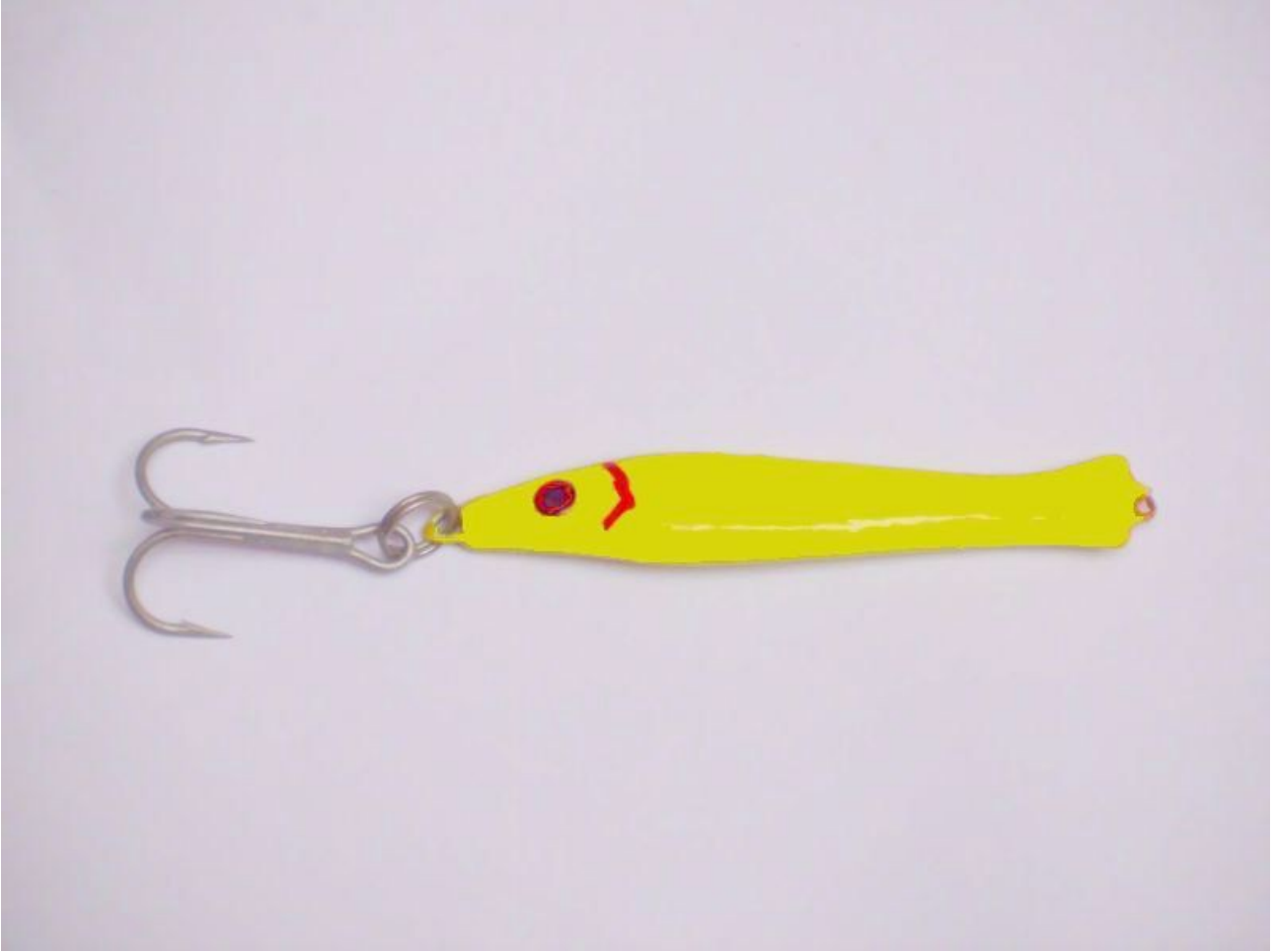
Bild 21 Seelachsbenno