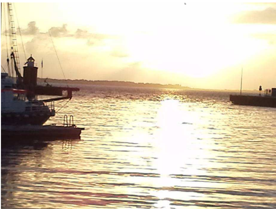
und Sonnenuntergang (Handyaufnahmen)