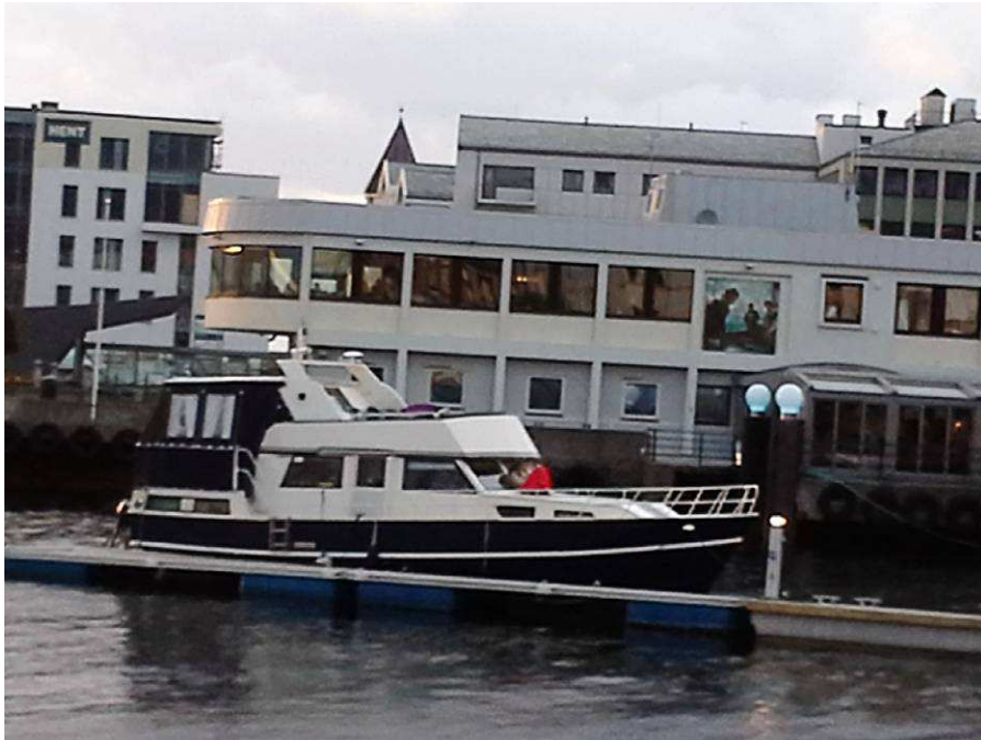
XL-Diner in der Skaregata

Für das Abendessen hatten wir uns an der Rezeption nach einem Restaurant mit Klippfisch erkundigt. Die freundliche Dame reservierte uns dann gleich einen Tisch im XL-Diner. Ich hatte etwas Hartes, Trockenes und Zähes erwartet. Stattdessen bekamen wir eine schöne Portion Fisch mit Gemüse etc serviert. Nun gut, Frischfisch schmeckt doch deutlich anders, aber es war durchaus ein schmackhaftes Gericht. Wieder eine Erfahrung mehr.