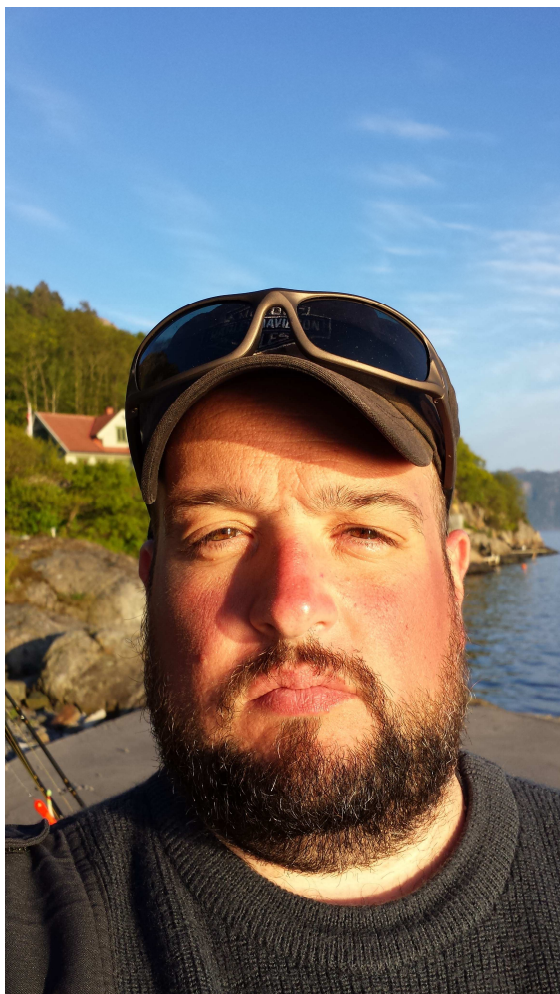
SONNENBRAND AM 1. TAG! Yeeeaaha