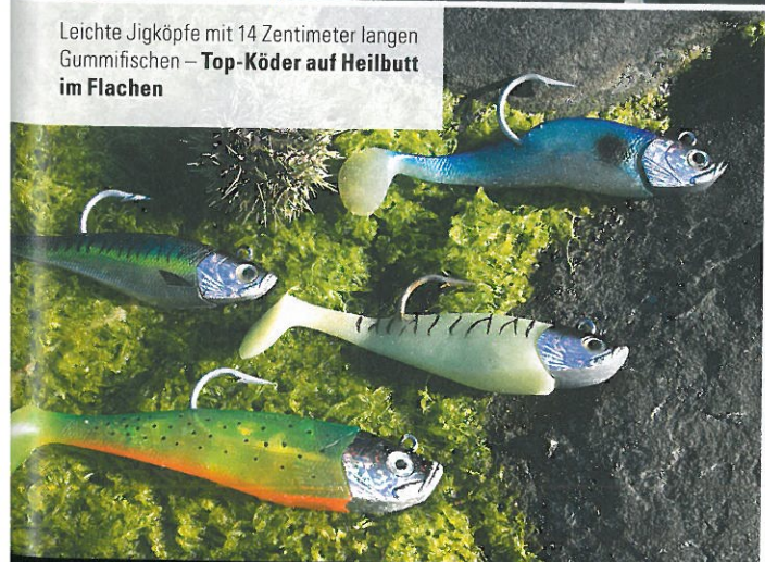
Leichte Jigköpfe mit 14 Zentimeter langen Gummifischen – Top-Köder auf Heilbutt im Flachen