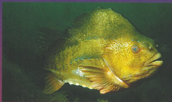
Achtung, liebes Seehasen-Männchen , lass Dich nicht von einem Heilbutt erwischen

Als ich vor einigen Jahren im Mai zum Heilbuttangeln in Norwegen war, erzählte mir ein Fischer, dass die Heilbutt zu dieser Jahreszeit am liebsten Roggenkekse fräßen. Auf meine Frage, ob er es für richtig hielt, bereits am frühen Morgen Alkohol zu trinken, erwiderte er: „Nein, ich meine das ernst! Den deutschen Namen kenne ich nicht, aber auf Englisch heißen die Dinger „Lumpsucker“ und auf Norwegisch „Rognkjeks“.“