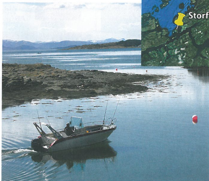
Die Kvernø-Aluboote liegen in einem geschützten Privathafen