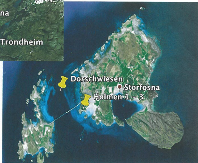
Die Insel Storfosna liegt rund 120 Kilometer von Trondheim entfernt. Die Flachwasserzone zwischen Storfosna und Kråkvåg ist die berühmte Dorschwiese