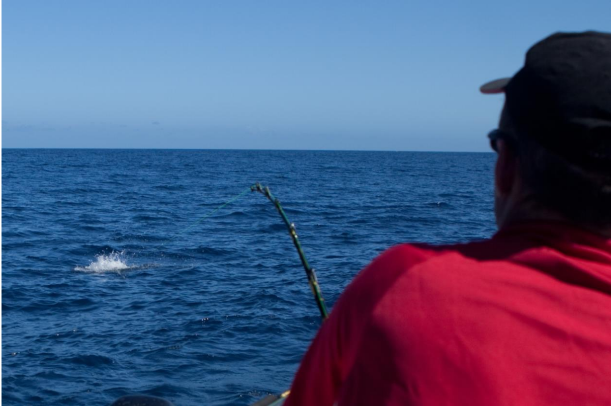
Wahooalarm.auf allerhöchster Ebene