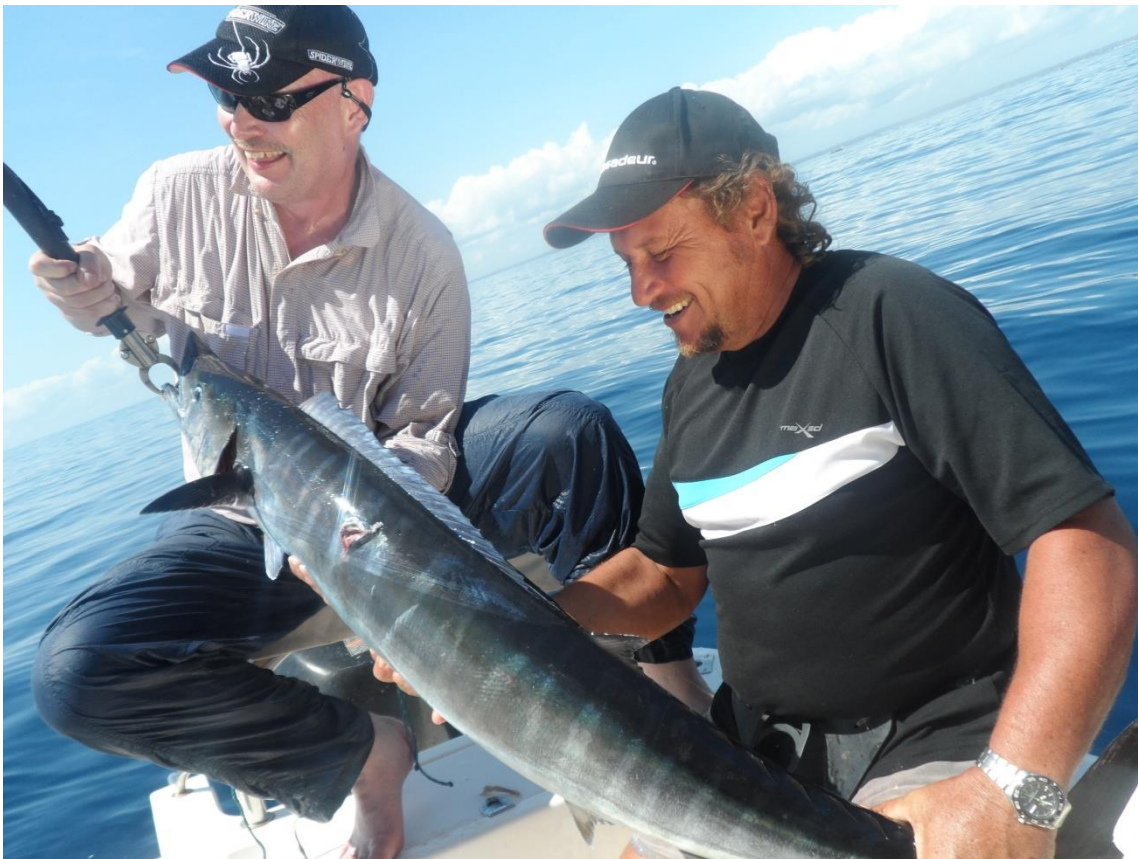
Wahoos lauerten überall und es verging kein Tag an dem wir nicht etliche fingen.