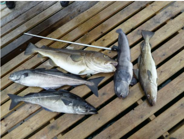
Jeder hatte sein Fangerlebnis...

So hatten wir bei dieser Ausfahrt alle drei ein schönes Erlebnis gehabt.