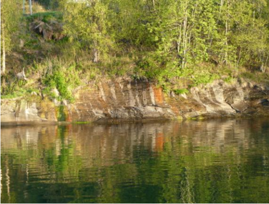
Farbige Felsen vor Teistevoll