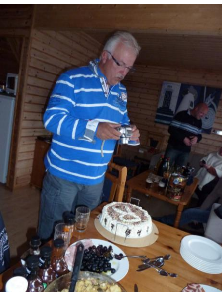
Geburtstagstorte als Geschenk unserer Freunde: Kalorien satt !