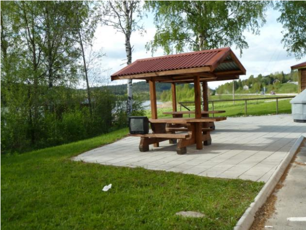
Schwedischer Rastplatz mit TV-Angebot

Es ging durch DK über Malmö - Helsingborg - Stockholm (bei Nacht) - Sundsvall - Lulea - Töre zum Polarkreis.