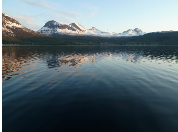
Blick von der Brücke zurück auf Foldvik und die Anlage

Leider war diese erste Ausfahrt nicht sehr erfolgreich. Einigen Küchendorschen war das Wasser zu kalt und wollten in unsere warme, schwarze Kiste.