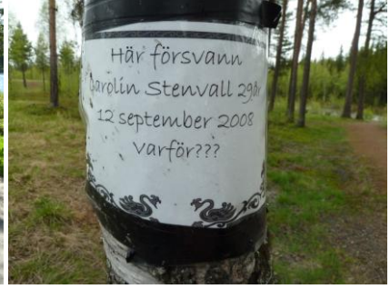
Rastplatz in Schweden: Vorbildliche Sauberkeit, idyllisch gelegen. Ein Ort zum Frühstück. Allerdings auch ein Ort mit schlimmer Geschichte...