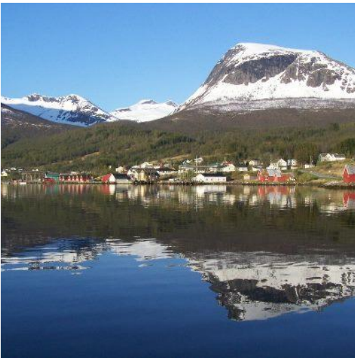
Foldvik im Morgengrauen (!) Unsere Anlage links im Bild. Hausberg Nonsfjellet (1139 m), im Hintergrund der Revtind (1219 m)

Ansonsten verliefen die nächsten Tage ohne weitere Höhepunkte. Die Kleinfischschwärme haben wir auch nicht wiedergefunden. Eine Frage an die Fischexperten: Ein Dorsch spuckte einen dieser Fische recht unversehrt aus: ca. 10 cm lang, blausilberne, verhältnismäßig große Schuppen und einen Unterkiefer, der sich extrem weit nach unten ausklappen ließ. Hering ? Sprotte ?