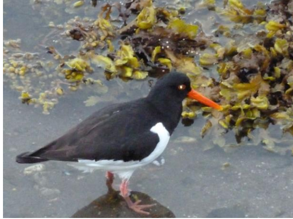
Mein Freund, der Austernfischer