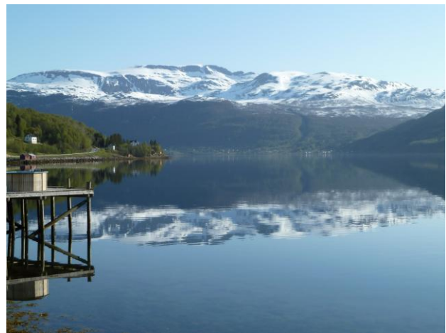
Am ersten Morgen: Was für ein Empfang! Der Gratangen spiegelglatt, die Sonne brennt.

Am nächsten Morgen erwartete uns der Gratangen in bestem Gewand. Keine Wolke am Himmel, unser Fixstern brüllte vom Himmel. Da wir am Abend alle nötigen Arbeiten erledigt hatten, konnte es gleich nach dem Frühstück losgehen. Unser erstes Ziel war die Brücke im hinteren Teil des Gratangen.