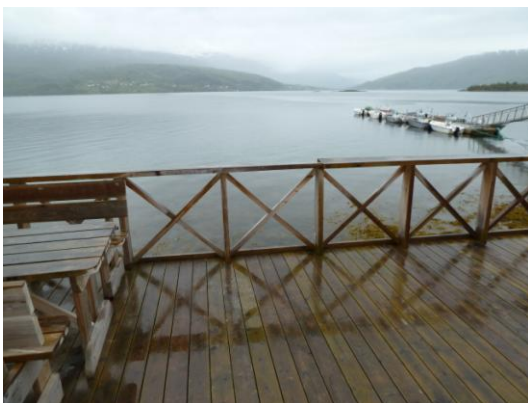
Freitagmorgen - es schüttet wie aus Eimern !