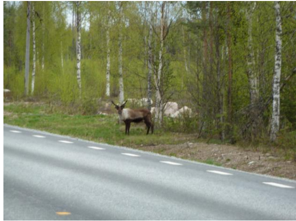
Karibus - zufällig gerade am Napapiiri- also rüber über die Straße und Bilder gemacht (nur nicht zu nah ran...)

Vom Polarkreis fuhren wir weiter über Kiruna - Riksgrensen - Foldvik.