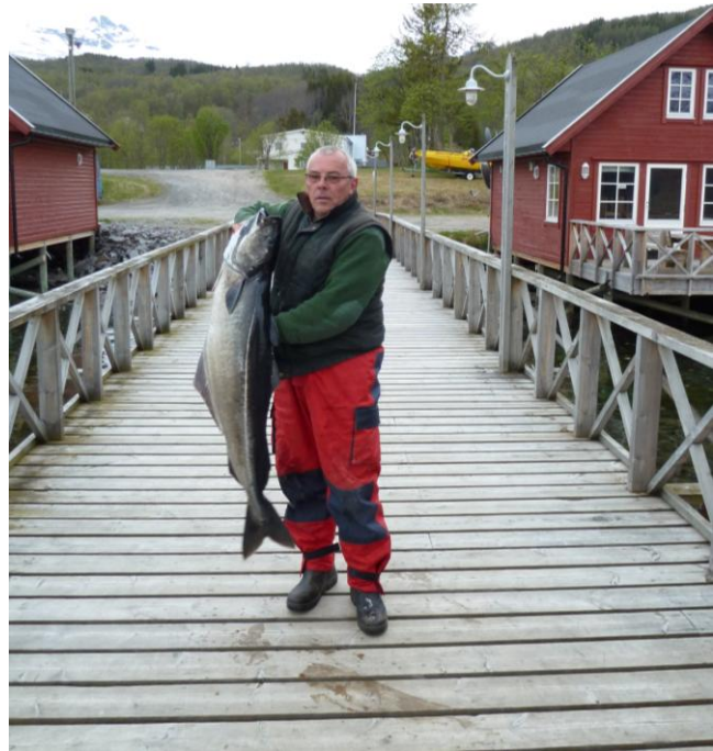
DER Köhler meines Lebens ! An den Drill werde ich Zeit meines Lebens denken.

Dieser Fisch war es wert, noch ein wenig gefeiert zu werden und so wurde es sehr früh.