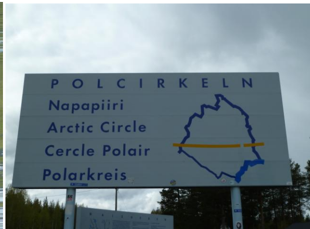
Der Polarkreis auf der E 10

Auf der Strecke vor dem Polarkreis kamen die ersten Karibus in Sicht. Achtung, diese Tiere lieben es, direkt vor den Autos auf die Strasse zu springen und Vollbremsungen zu erzwingen. Mögen sie den Gummigeruch oder lieben sie das Quietschen ?