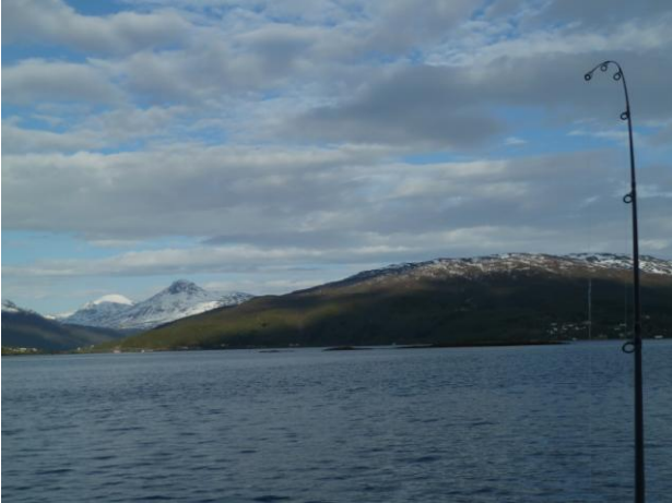
So sieht man die Halbinsel bei "Nacht". Gaaanz hinten die Brücke.