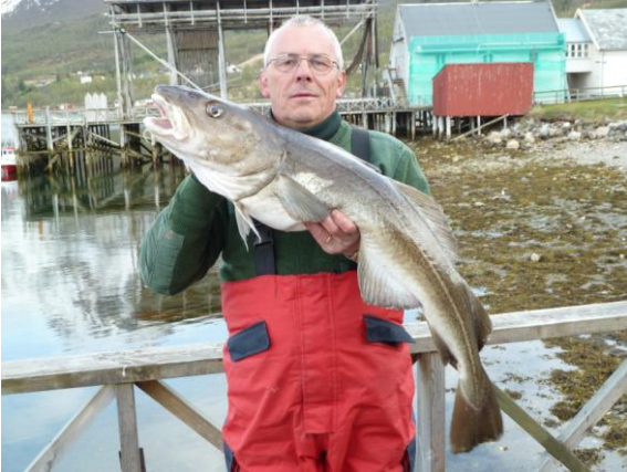
Mein erster Kracher. Mit 108 cm schon mal was "Großes"

Abends ging es dann wieder an unser „Dorschufer“. Auf dem Echolot hatten wir sporadisch seltsame „Wolken“ im Mittelwasser und da drunter immer wieder Fischanzeige. Einige dieser „Fischanzeigen“ entpuppten sich als Dorsch so um die 60 – 80 cm, welche wir aufs freudigste abhakten und in der Bütt verschwinden ließen. Die Entfernung zum Ufer betrug zwischen 15 und 40 Metern bei einer Tiefe von 12 bis 30 Metern.