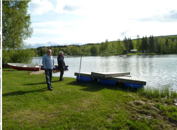
Badeplatz in Schweden, "schon" oberhalb Umea

Die schwedischen Rastplätze sind bemerkenswert sauber. Die Toilettenhäuschen sind beheizt und haben auch warmes Wasser. Da hat man an norwegischen Straßen schon ganz andere Erlebnisse gehabt.