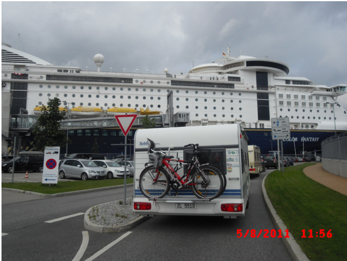
Ankunft In Kiel - Color Fantasy Wartet Schon

Mit Einer Fähre Hat Dieses Schiff Kaum Noch Etwas Zu Tun. Einzig Das Man Sein Auto Dabei Hat Erinnert Noch An Ein Fährschiff.