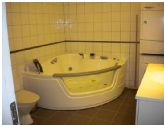
Bad mit Wirlpool und Farbenspiel. Ein Spass für die Kinder(die zwei Kleinen).