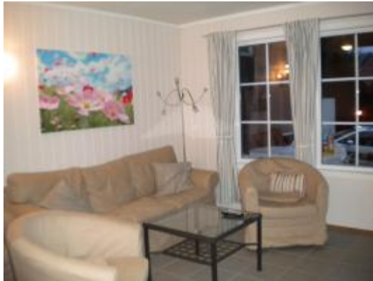
Wohnstube mit offener Küche.

Ein Grund hierfür waren wohl seine Englischkenntnisse und sein anschließender Job als Übersetzer.