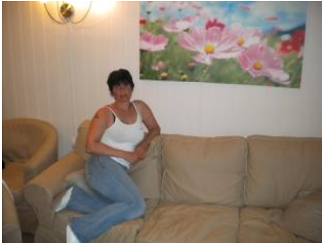
Meine liebe Frau.