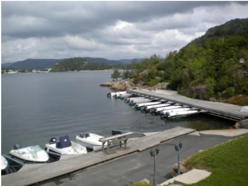
Blick vom Haus zu unserem Steg.

So nun aber zum Angeln und unserer ersten Ausfahrt. Alle an Bord und los.