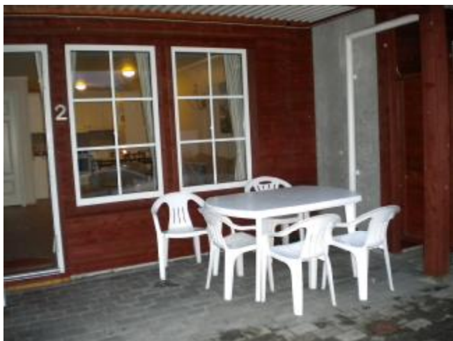
Terrasse bei einsetzender Dunkelheit.