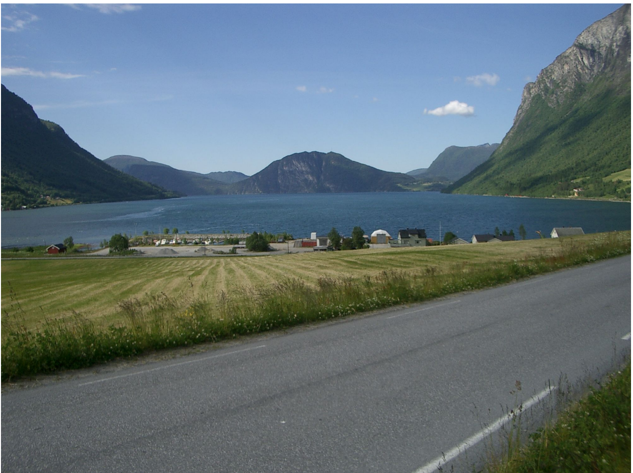
Blick auf den Innfjord mit Hafen von Innfjorden aus

Der Fjord liegt Quer zum Hauptfjord und eine Bergkette liegt zwischen ihm und den Atlantik. Durch diese Lage hat man fast keine wetterbedingte Ausfalltage beim Angeln.