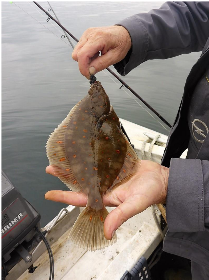
Auch an Beifang gab es einiges