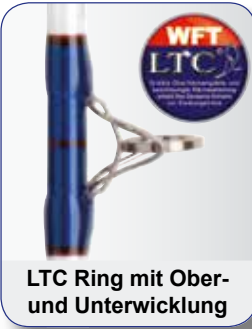
LTC Ring mit Ober- und Unterwicklung