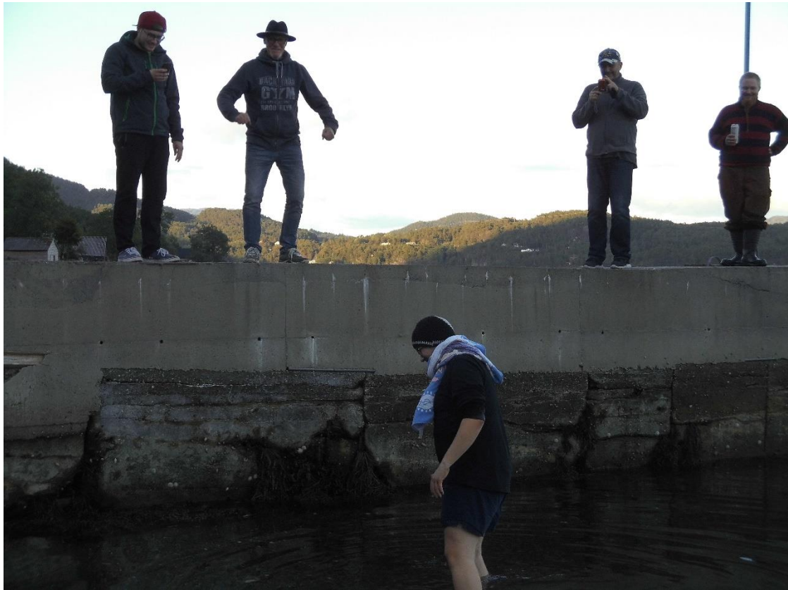
Der erfolgreiche Angler und die schadenfrohe Mannschaft

Wasser schritt. Leider konnte er sein Pokerface wahren, was mich dazu verleitete, meine Klappe weit aufzureißen. Wenn er mindestens bis zu seinem Hintern ins Wasser ging, würde ich, sollte ich metern, einen Flachkörper machen. Da ging er drauf ein und machte trotzdem keine Quieck-Geräusche - eine kleine Enttäuschung bei dem Spaß ;-) Zu Essen gab es dann erst einmal Bockwürste und Nudelsalat. Schnell gemacht, aber trotzdem ein Genuss!