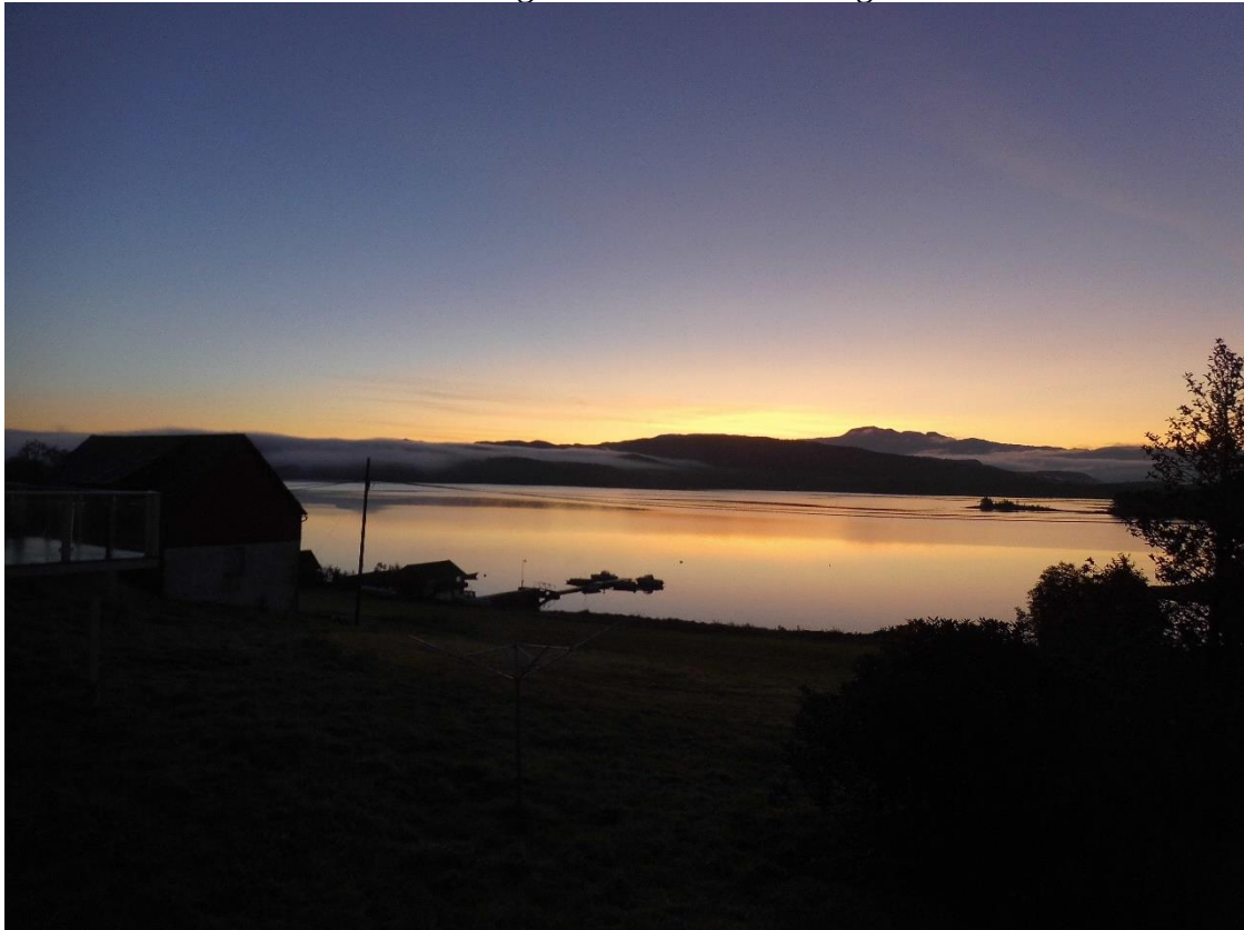
Goldener Sonnenaufgang am Abreisetag

Wahrscheinlich um uns unsere Abfahrt noch schwerer zu machen, schien heute die Sonne und verkündete die Möglichkeit für tolle Ausfahrten. Aber leider mussten wir los und so wurden statt Fische nur noch ein paar Momente mit der Kamera gefangen. Zumindest konnten wir unsere letzten Stunden in Norwegen in diesem Jahr voll genießen.