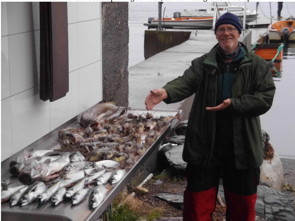
Präsi präsentiert die Fänge

Immerhin konnten wir so, wenn auch mit weiterer Verspätung, selbst in den Hafen einlaufen. Dann begann das Filetieren. Neben vier Pollacks, einigen Makrelen, die wir beim Knurrhahn angeln fingen, drei Lengs (zwei lütje und der bereits erwähnte 90er) waren gefühlt zahllose Knurrhähne im Eimer. Viele hatten eine beachtliche Größe und nur wenige waren Knurrhähnchen (wenn ich das schreibe, denke ich an Geflügel). So kamen wir erst spät zum Duschen und noch später zum Essen (was auch wirklich nötig wurde). Zwar spielten wir dann noch eine Runde Karten, aber es konnte nicht einmal der beste Spieler gewinnen, sondern der größte Glückspilz.