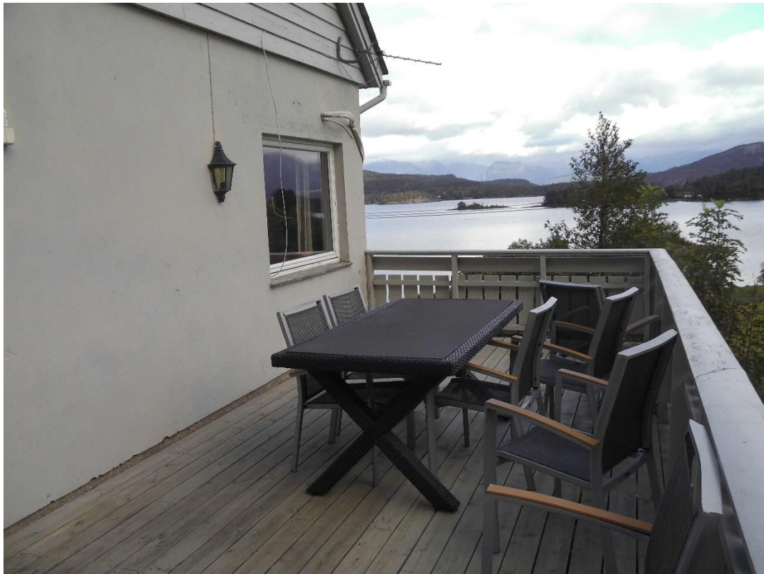
Terrasse mit Gartenmöbeln und hinter dem Photograph auch einen Grill

Das Haus war recht spartanisch eingerichtet. Es gab alles notwendige zum Leben, aber richtig gemütlich war es nicht. Die Matratzen waren in einigen der Schlafzimmer viel zu weich und gingen ganz schön in den Rücken. Das gesamte obere Stockwerk mit den Schlafzimmern hatte keine Heizung und erst recht spät entdeckten wir den Heizstrahler, der oben die Kälte vertrieb. Die Töpfe in der Küche hatten teils keine Griffe mehr (echt schwer, so das kochende Nudelwasser abzugießen) und die Messer waren ziemlich stumpf und schartig (aber als Angler sollte man ein Messer natürlich auch wieder scharf bekommen). Dafür gab es viel Stauraum in der Küche und die Schränke waren auch nicht schlecht. Der Esstisch war genau groß genug für uns sechs. Aber zehn Mann kann ich mir da nicht vorstellen und für so viele ist das Haus laut Internet ausgelegt. Die Badezimmer waren nicht überragend. Eine der Duschen sorgte für Überschwemmungen, eines der Badezimmer hatte keine Handtuchhalter und das andere keinen Abstellplatz für Hygieneartikel wie Zahnbürste und Co. Das Wohnzimmer war ziemlich gemütlich mit einem bequemen Sofa und die Terrasse mit dem Grill war mit neuen Möbeln ausgestattet und konnte mit einer wunderbaren Aussicht dienen, die ich wirklich vermisse. Besonders zu erwähnen ist auch der Keller, in dem wir neben einem Trockenraum auch viele Abstellräume hatten, die wir nicht im Ansatz füllen konnten. Der war wirklich ein Plus!