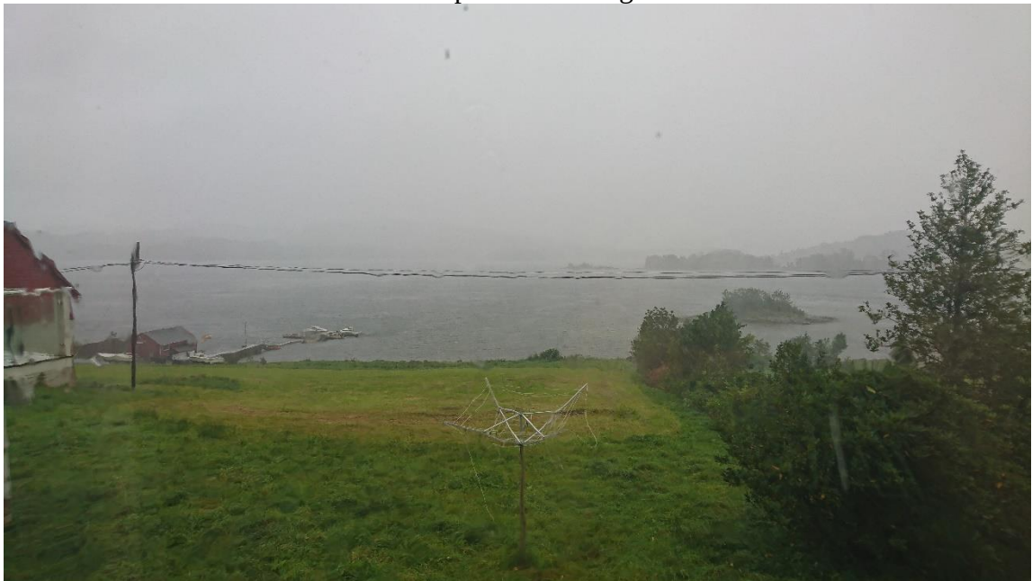
Regnerische Aussicht aus dem Fenster

Etwas später am Tag brachte uns der Freund/Mitarbeiter unseres Vermieters die Mäusefallen, die bis zum jetzigen Moment noch keinen Besuch erhalten haben. Aber vielleicht bringt die Nacht noch eine Maus, denn sonst würde dieser Tag wirklich komplett ohne Fang enden.