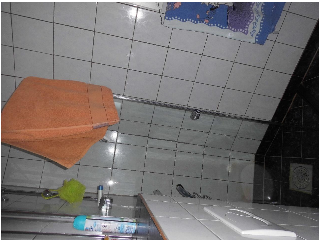
Bad ohne Handtuchhalter