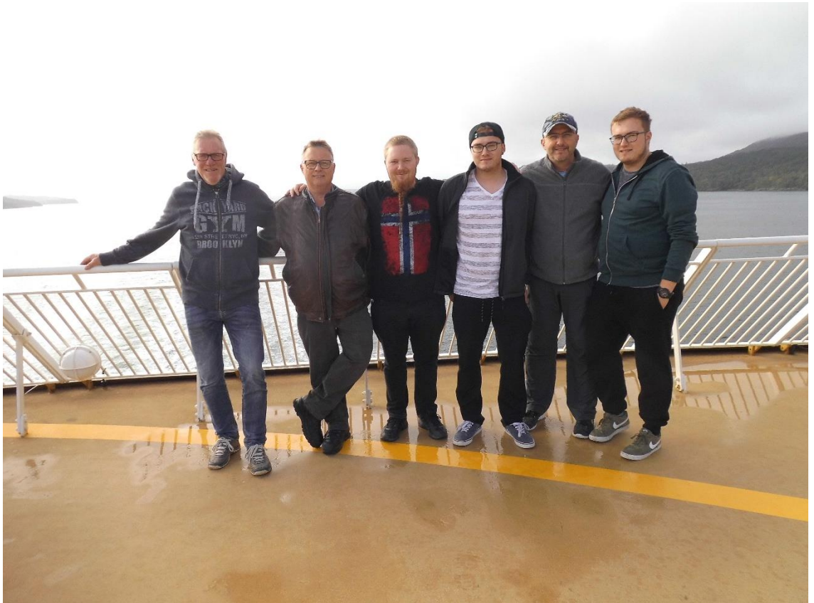
v. l. n. r.: Präsi, Vize, der Bärtige, Schlemmer, Smootje und Schlummer mit Schlemmerbauch

Nach einem kleinen Bier verabschiedete sich der gute Mann auch wieder (aber keine Sorge, er nahm es mit und war nicht unter Alkohol am Steuer ;-)) und wir schmissen den Grill an. Nichts muntert einen so gut auf, wie ein kühles Bier und ein feines Kotelett. Naja, vielleicht weniger Wind, aber das wird wohl erst ab Montag der Fall sein.