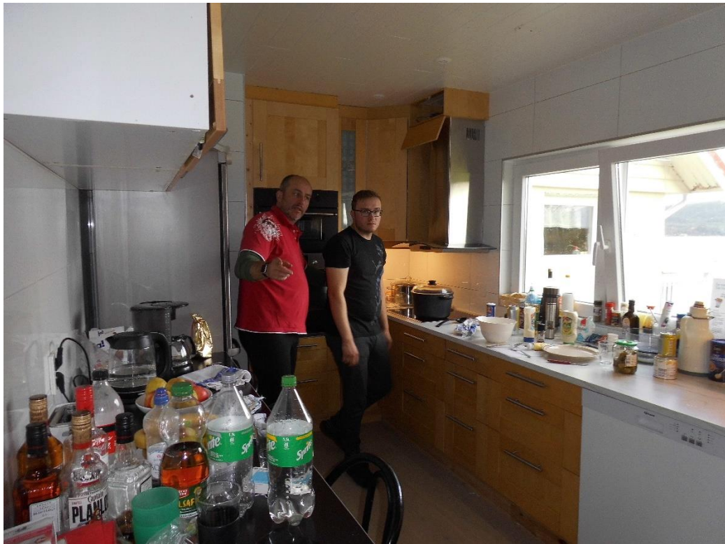
Küche mit Smootje und Schlemmer (wen sollte man da auch sonst finden)