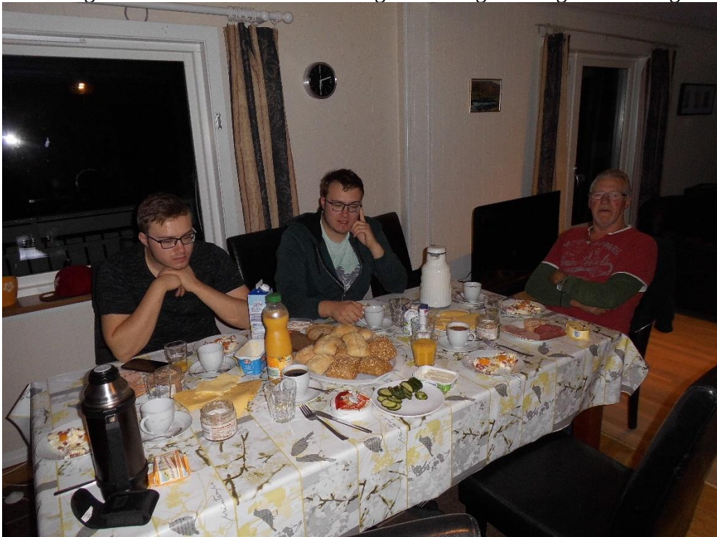
Schlemmer, Schlummer und Präsi am Frühstückstisch

Am nächsten Morgen haben der Vize und ich erstmal ein feines Frühstück mit Spiegeleiern und Schinkenwürfel gezaubert. Schließlich muss vor großen Fängen eine gute Stärkung stattfinden.