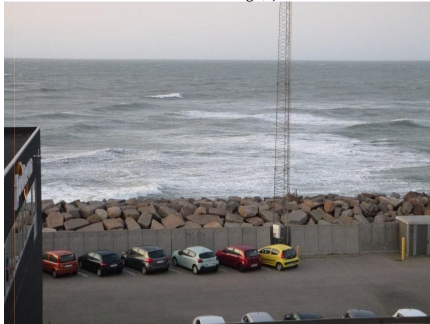
Wellengang in Hirtshals

Ansonsten tranken wir noch ein Bier oder drei und spielten einige Runden Schwimmen. Dazu gab es ein paar deftige Sprüche und Dickenwitze bei denen (Vorsicht, der kommt jetzt flach) jeder sein Fett weg bekam :-D Also ein rundum gemütlicher Abend, an dessen Ende wir von den Wellen nicht ganz sooo sanft in den Schlaf gewogen wurden.