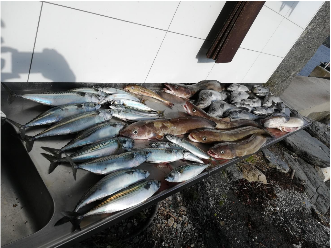
Ein erfolgreicher Fangtag!

Am nächsten Morgen haben der Vize und ich erstmal ein feines Frühstück mit Spiegeleiern und Schinkenwürfel gezaubert. Schließlich muss vor großen Fängen eine gute Stärkung stattfinden.