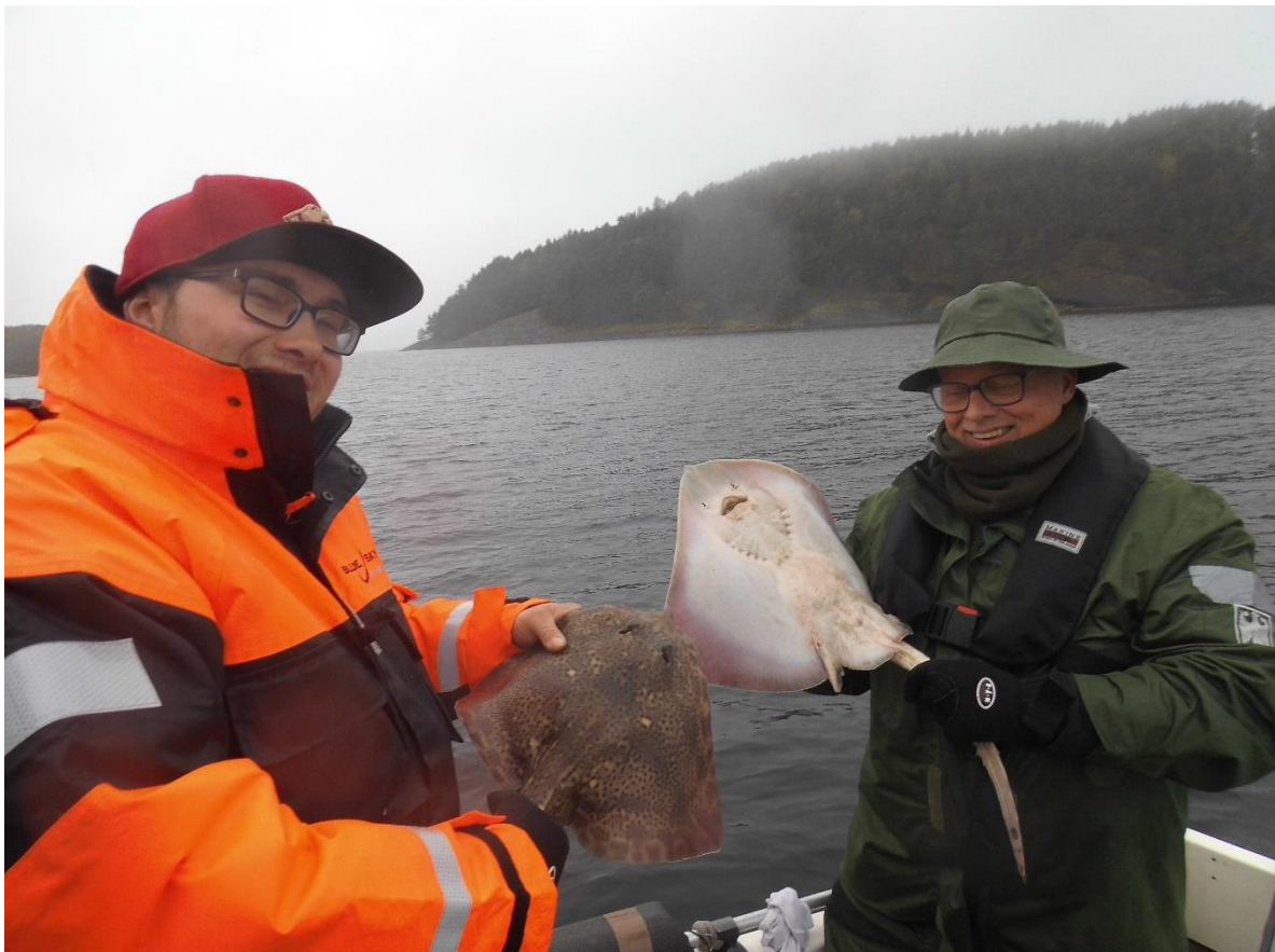
Schlemmer und Vize mit ihren Rochen