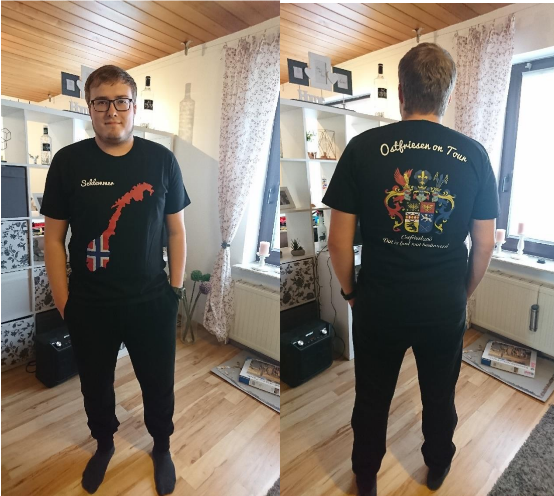
Schlummer als Model

PS: Ich hatte ja erwähnt, dass wir uns Shirts bestellt hatten. Da möchte ich euch auch kein Foto vorenthalten: