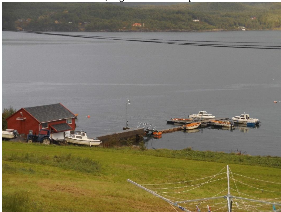
Ein weiteres Foto mit Wäschespinne

Nach dem obligatorischen Filetieren, gab es heute die frischen Fänge aus der Pfanne mit einer selbst gekochten Dill-Senf-Soße und Bratkartoffeln. Ein wahrer Gaumenschmaus und sogar besser als die gestrige Lachs-Sahne-Soße! So vollgestopft und nach der Dusche auch nicht mehr so nach Fisch riechend, begann das Karten spielen.