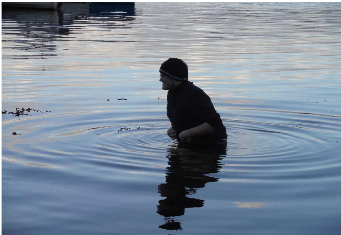
Der sterbende Schwan