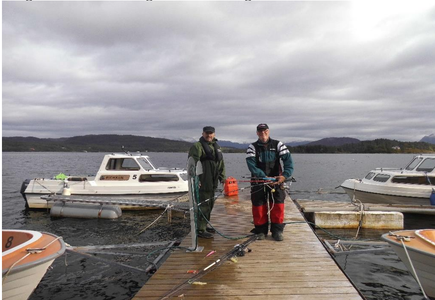
Präsi und Smootje beim Boote räumen

Nach der Fischverarbeitung bekamen wir wieder ein köstliches Mahl von unserem Smootje vorgesetzt. Heute gab es Bami Gureng und es wurde gefuttert, bis man uns nur noch rollen konnte.