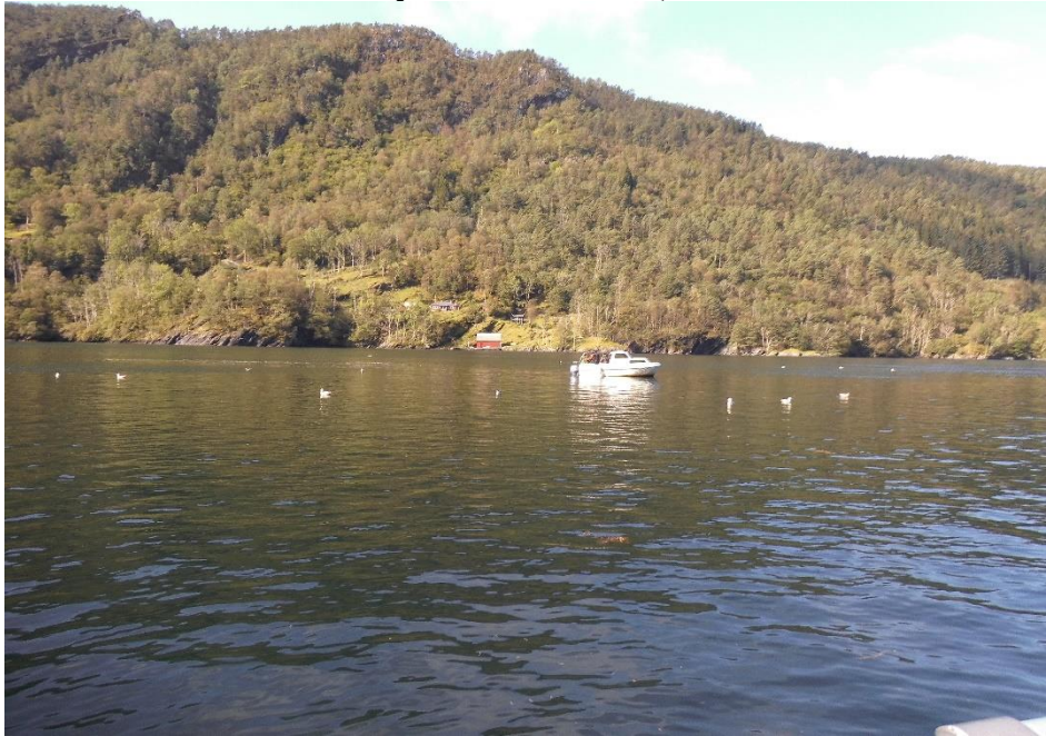
Lukksund mit einem unserer Boote

Wir wussten gar nicht, worüber wir uns mehr freuen sollten - den tollen Fisch oder einen quiekenden Präsi ;-)