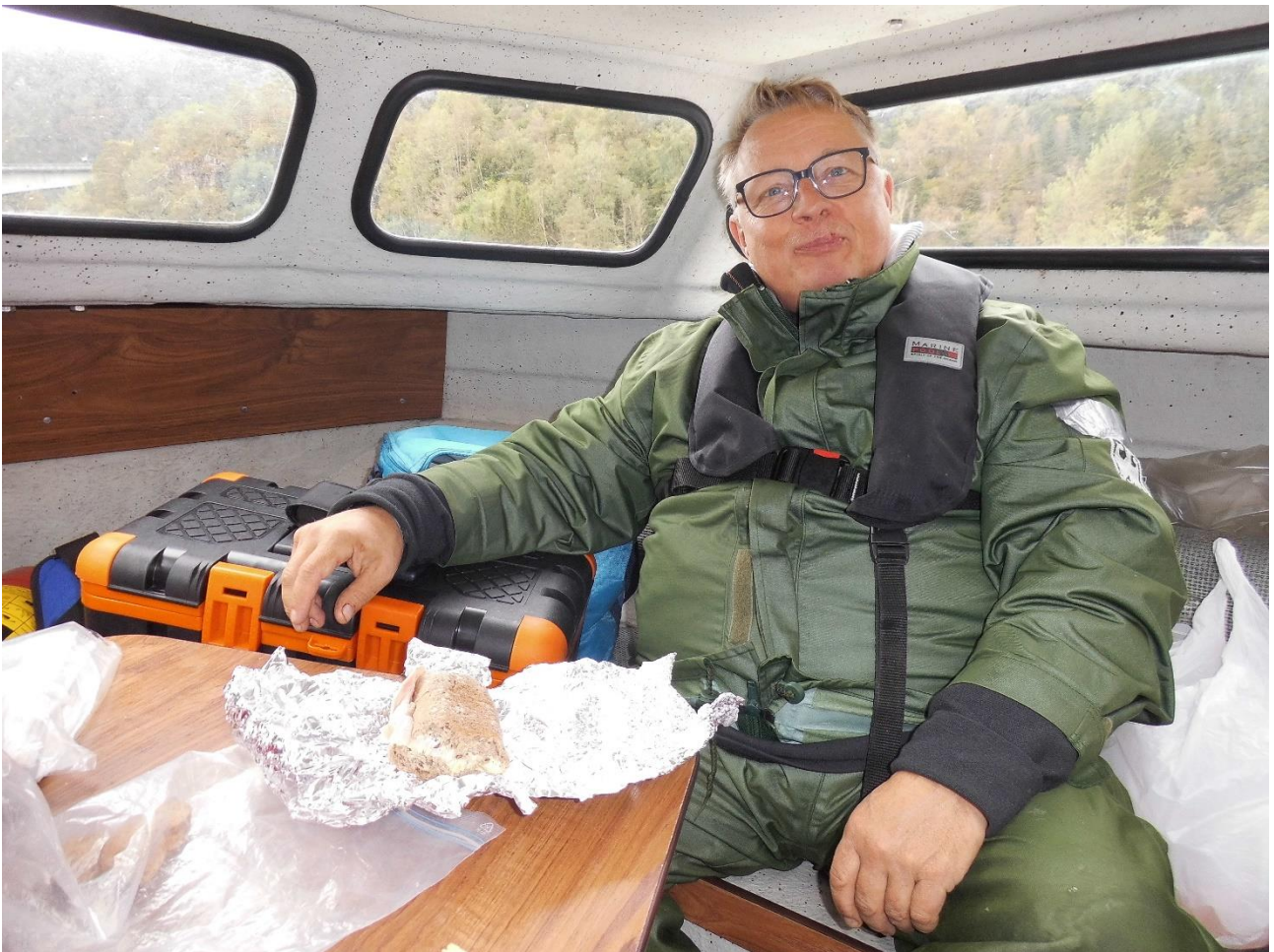
Ohne Mampf kein Kampf