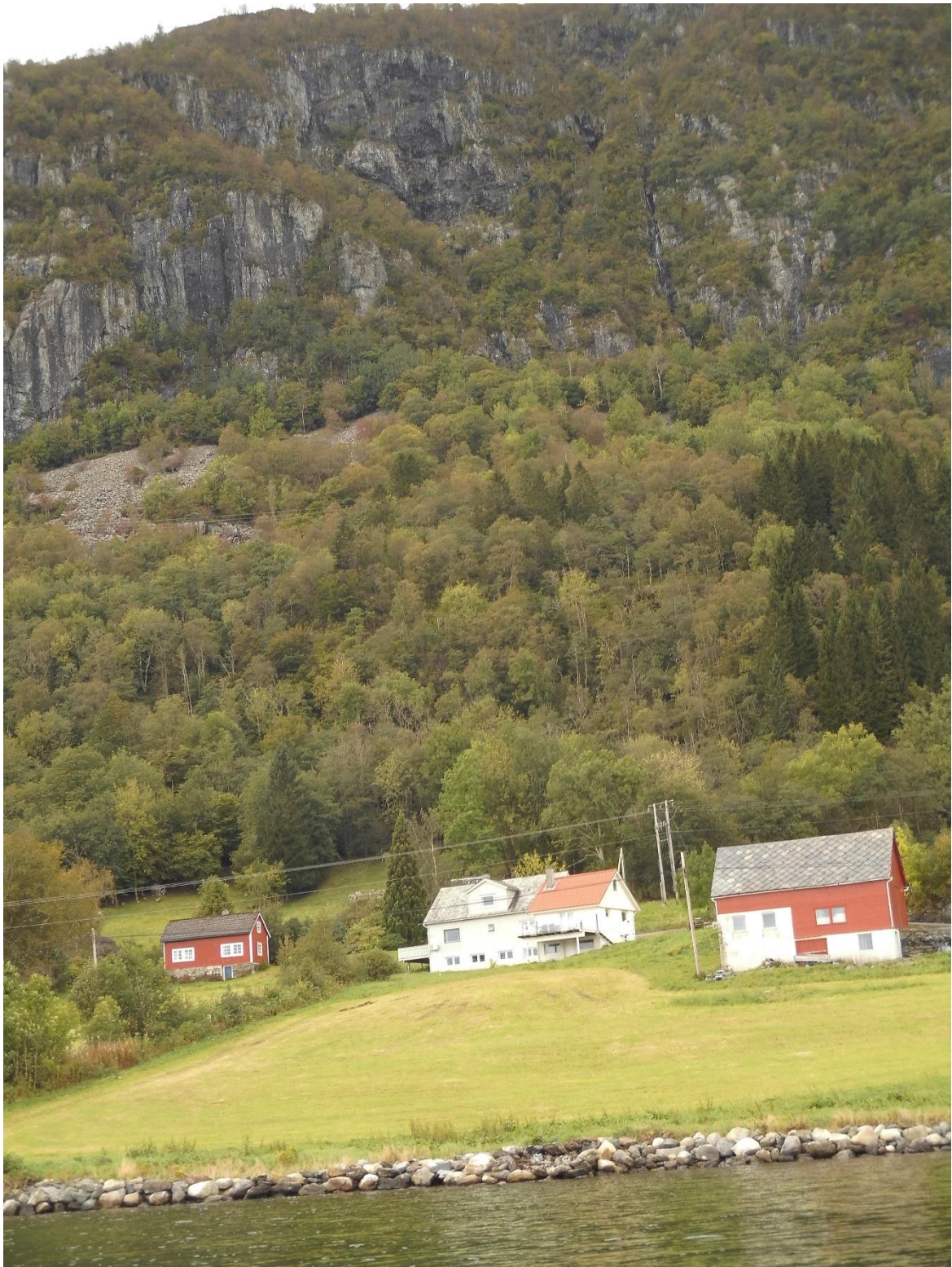
Hütte mit Berg