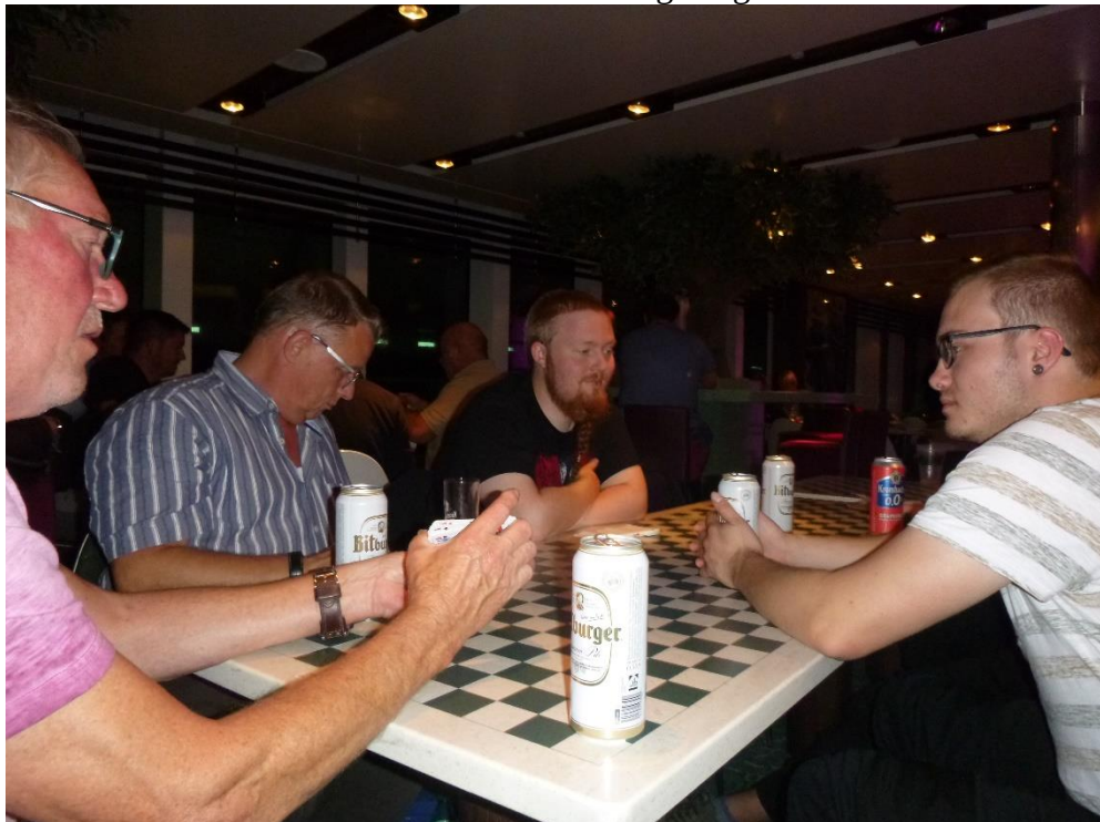
Gemütlicher Abend auf der Fähre

Ansonsten tranken wir noch ein Bier oder drei und spielten einige Runden Schwimmen. Dazu gab es ein paar deftige Sprüche und Dickenwitze bei denen (Vorsicht, der kommt jetzt flach) jeder sein Fett weg bekam :-D Also ein rundum gemütlicher Abend, an dessen Ende wir von den Wellen nicht ganz sooo sanft in den Schlaf gewogen wurden.