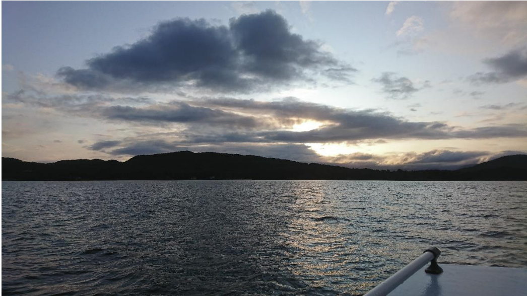
Atemberaubende Aussicht am Morgen