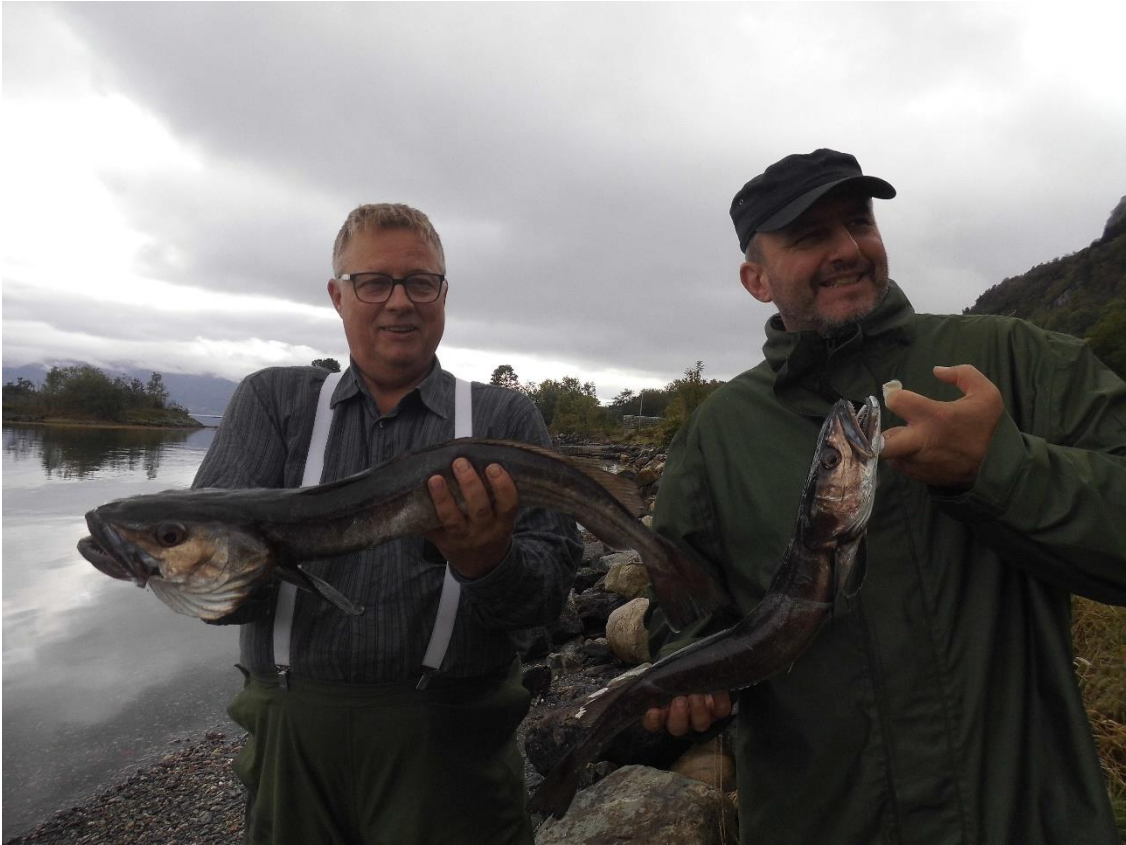
Zwei ganz tolle Hechte

Wahrscheinlich um uns unsere Abfahrt noch schwerer zu machen, schien heute die Sonne und verkündete die Möglichkeit für tolle Ausfahrten. Aber leider mussten wir los und so wurden statt Fische nur noch ein paar Momente mit der Kamera gefangen. Zumindest konnten wir unsere letzten Stunden in Norwegen in diesem Jahr voll genießen.