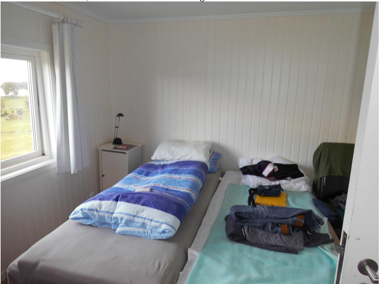
Ein Schlafzimmer (die im Grunde immer gleich waren)

Ein Manko, das ich im Allgemeinen bei dieser Art von Boot sehe, sind die fehlenden Sitzmöglichkeiten außen. Gerade unsere Alten, aber auch wir Jungen bekamen irgendwann müde Füße beim Naturköderfischen und an der Reling zu sitzen, sorgte auf Dauer auch nicht für viel Komfort. Aber das sind so allgemeine Dinge zu dieser Art von Boot. Unsere Boote im Speziellen waren nicht sonderlich gut gepflegt. Im Laufe der Woche konnten wir in einer der Schrauben Angeschnur mit Pilker finden, die uns bei der Bootübernahme nicht aufgefallen war. Aber auch ansonsten könnten die Boote etwas Pflege gebrauchen, denn es gab lockere Griffe (so eine Haltestange über der Kabine ließ sich so rausschieben) und herausragende Schrauben, die ein gewisses Sicherheitsrisiko darstellten. Was wir ebenfalls nicht so schön fanden war, dass wir am Anfang keine vollen Kanister mit Sprit bekommen hatten. Dafür hieß es, dass wir unsere Kanister auch nur leer wieder abgeben mussten. Hätte wir am ersten Tag direkt rausfahren wollen, hätten wir das nicht so früh gekonnt, da wir noch hätten Tanken müssen. Durch den Ausfalltag hatte sich das zwar relativiert, aber auf unseren drei vorherigen Reisen hatten wir das anders erlebt.