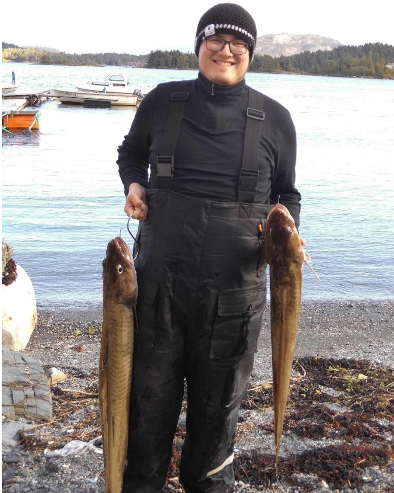
Der dicke (und sein) Fang mit einem breiten Grinsen

Danach ging es einmal mehr raus auf den Fjord. Gezielt hielten wir auf die Stellen zu, an denen wir am Vortag noch problemlos Makrelen überlisten konnten, doch heute hatten sie sich wirklich rar gemacht. Es dauerte mehr als 90 Minuten, bis wir endlich einen Schwarm auftrieben und von 5 Exemplaren auf mehr als 20 Stück erhöhten. Auf Gummifisch ließ sich zu dem Zeitpunkt leider kein Flossenträger verführen und nach einigen Versuchen und Spotwechselln, schipperten wir zum Lukksund, um wieder die Lengs zu bejagen. Da war die erste Drift absolut gigantisch. In meinem Boot, zusammen mit dem Präsi und unserem Smootje, hatten wir gleichzeitig Bisse und starteten unsere Drills. Leider gab es zwei Aussteiger und nur ein solider Leng bei 80cm besuchte uns im Boot. Bei den anderen ging es besser. Die landeten in kaum 10 Minuten zwei Lengs, die im 90cm Bereich waren und dann brach bei denen ein lautes Siegesgebrüll los, das vom Fjord widerhallte. Ein 110cm Leng schnupperte Morgenluft. Wir konnten unsere (Schaden)freude kaum unterdrücken :-D