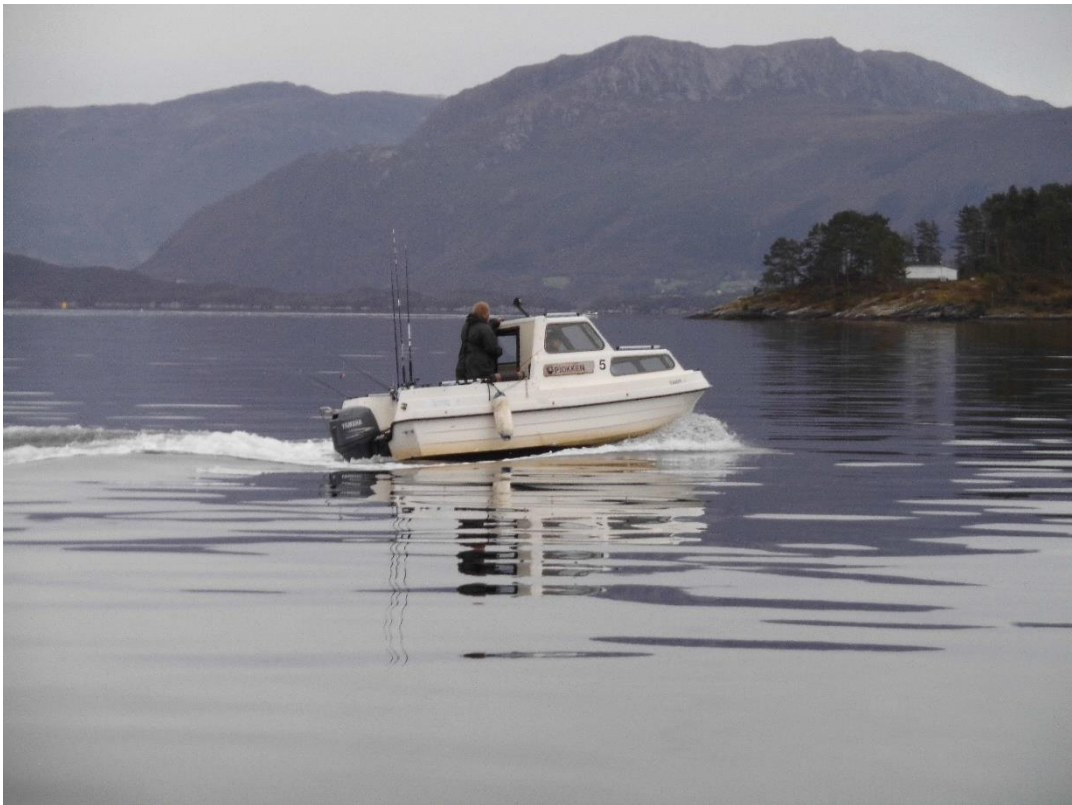
Bei diesigem Wetter mit voller Fahrt zum Fisch