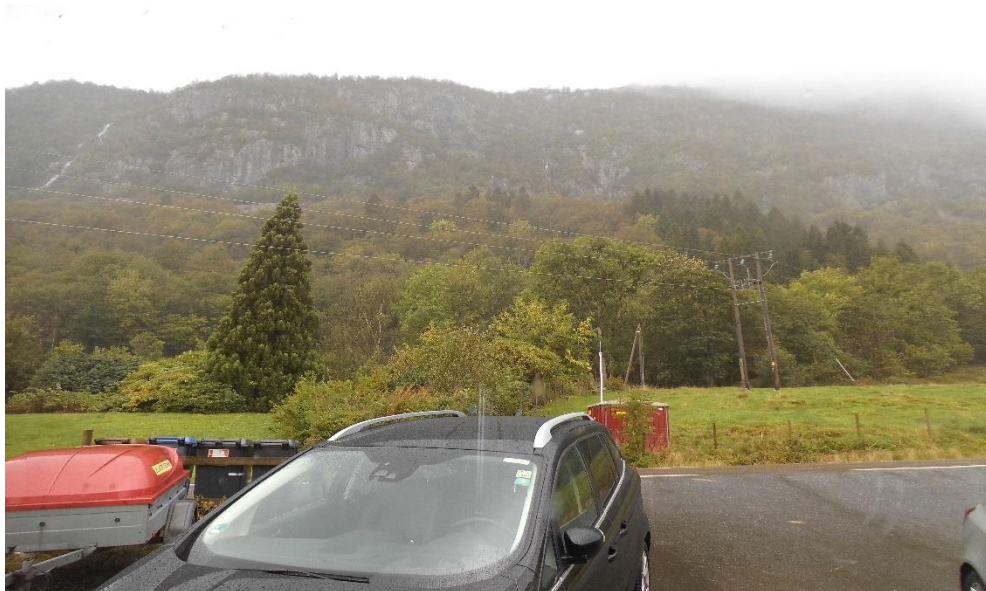
Rückseite der Hütte mit rauschendem Wasserfall

Einen Tag später darf ich vermelden: Der erste Fisch wurde gelandet. Doch bevor ich von Fängen berichte, fange ich wie gewohnt beim vorherigen Abend an. Denn auch gestern sind wir keine Schneider geblieben. Die Maus hat sich in die Falle verirrt. Allerdings hatte sie vorher schon unsere Mehltüte angeknabbert (war wohl eine vorschnelle Rache) und eine kleine Sauerei in der Schublade verursacht. Nun bleibt nur zu hoffen, dass unser Mäuserich keine