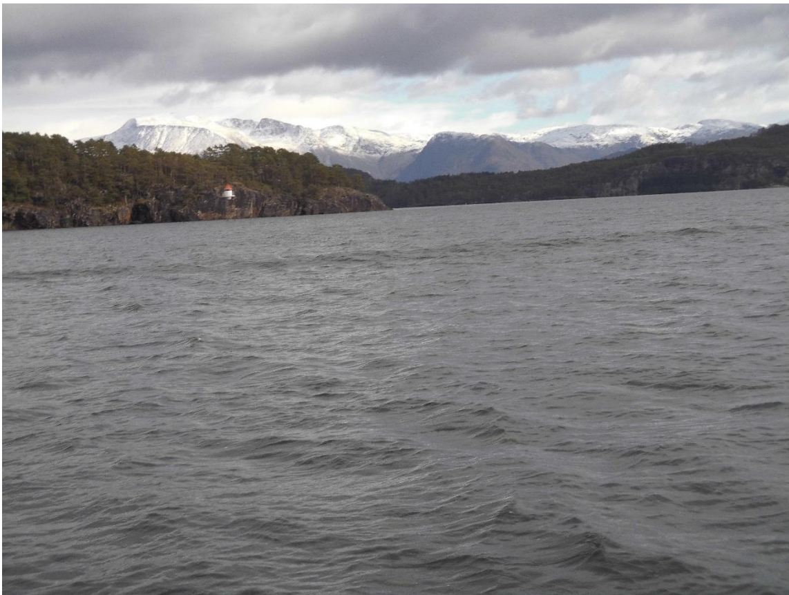
Gletscher und Fjord nahe des Lukksunds