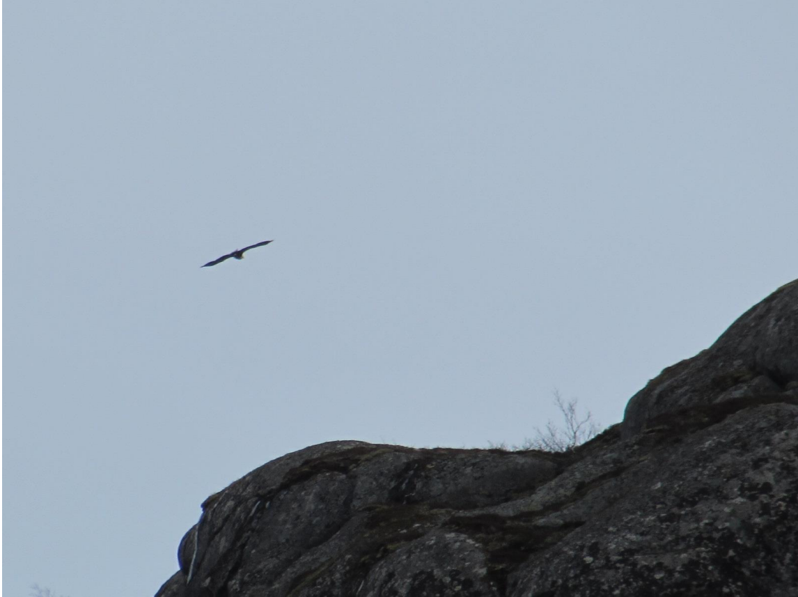
Adler im Trollfjord