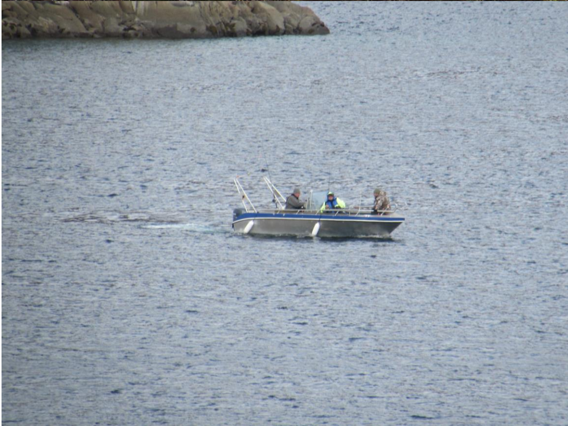
Geangelt wird hier auch